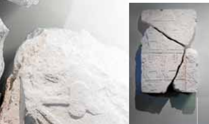
Pieza de tablero de cancel [siglos VII-VIII]. Procedente de las Excavaciones arqueológicas de Santa María de Lugo de Llanera (Emilio Olávarri, 1981)

Posteriormente, siguió siendo una de las principales vías de comunicación de los pueblos hispanos junto a la Vía Augusta, que recorría todo el Levante, desde Cádiz, hasta atravesar los Pirineos.