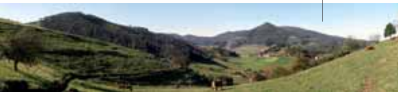
Vista panorámica del Pico Gorfolí.

Durante la época romana la vía se mantuvo como eje fundamental de las comunicaciones peninsulares tanto durante la conquista (al ser camino de acceso desde la Bética hacia el noroeste) como en época imperial. Pero es durante la Edad Media cuando recibe su denominación actual de la Vía de la Plata, al derivar su nombre del término árabe "balath o BaLaTa" que significa pavimento o camino pavimentado. Tuvo una gran importancia en esta época, ya que facilitó la penetración árabe al norte, y también el avance de las tropas cristianas reconquistadoras.